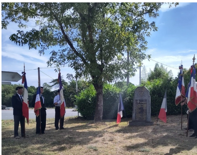
▲ Stèle du Moulin du Noble ▶

Le 21 août dernier, les communes de Saint Jean de Thurac, Saint Romain le Noble et Saint Nicolas de la Balerme et le Comité du Souvenir commémoraient le 78 ème anniversaire des combats des 15 et 17 août 1944.