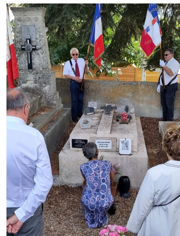
Tombe de l'Abbé Couderc ▶